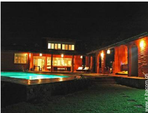
sistema di illuminazione