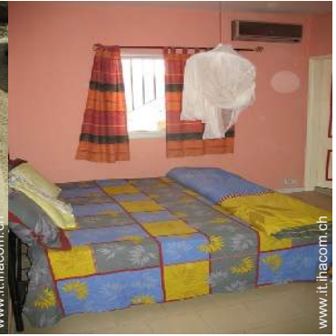
camera del proprietario