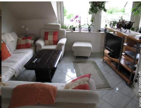
Comfort interno ed attrezzature