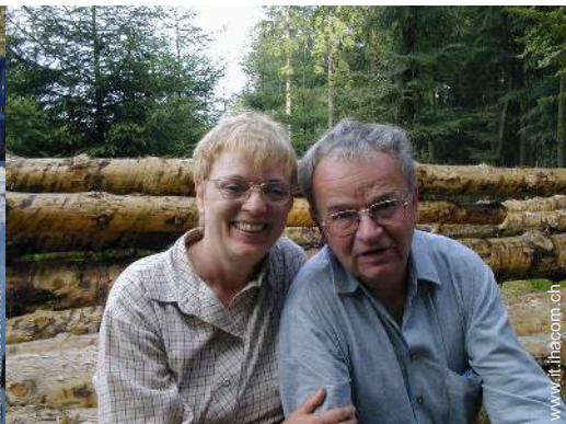
I vostri ospiti