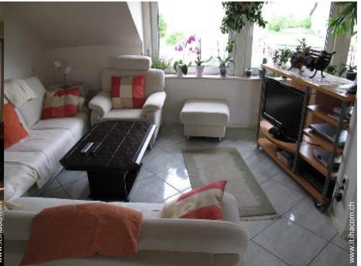
Comfort interno ed attrezzature