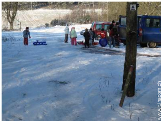
sport invernali nelle vicinanze