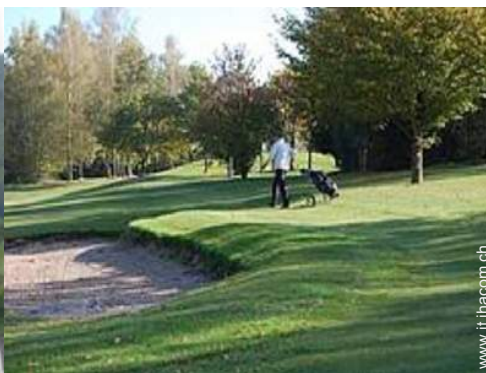
percorso di golf 18 buche