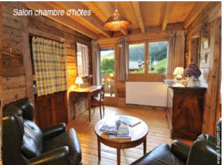
Salon chambre d'hôtes