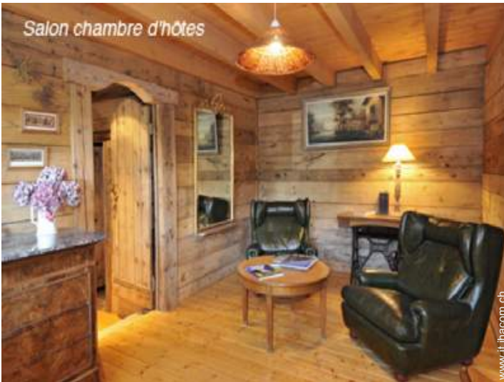
Salon chambre d'hôtes