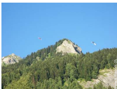
attività di volo nelle vicinanze