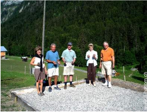
campo di bocce