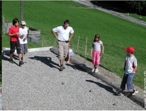
campo di bocce