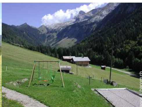
struttura rampicante per bambini