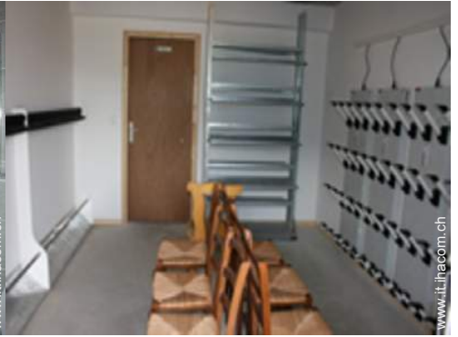
armadio per gli sci