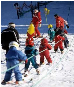
scuola di sci