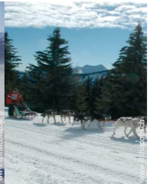
slitta con i cani