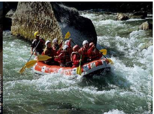
sport estivi nelle vicinanze