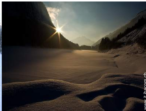
sport invernali nelle vicinanze