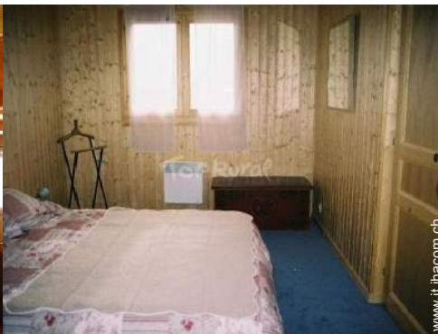
camera del proprietario