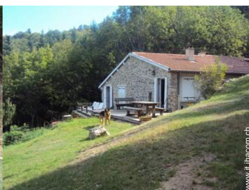
Ambito esterno a disposizione degli ospiti