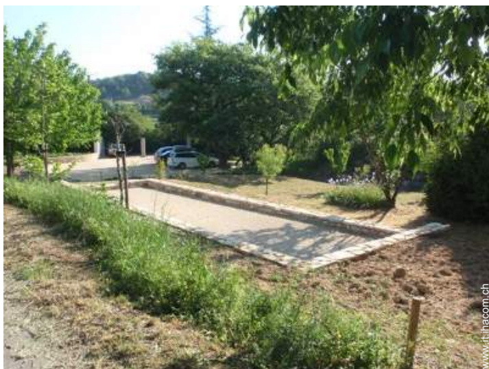
gioco delle bocce