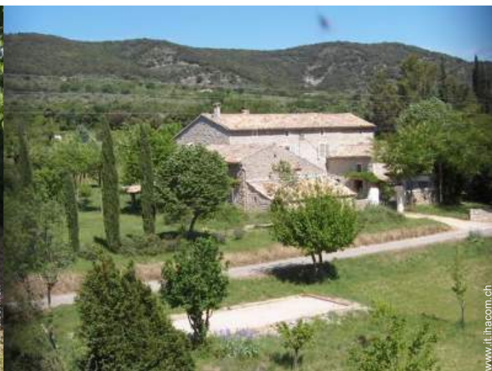
Casolare di Charme