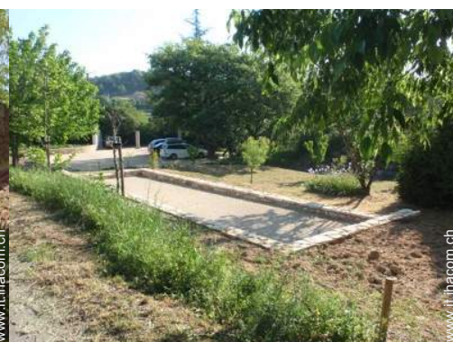
gioco delle bocce