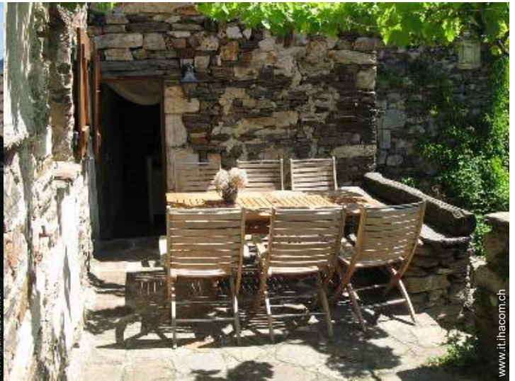
sedia(e) da giardino