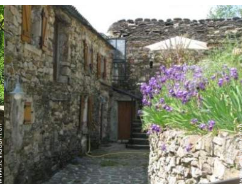
Dimora in Pietra di Charme