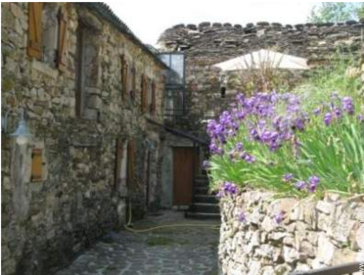
Dimora in Pietra di Charme