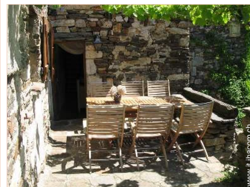
sedia(e) da giardino