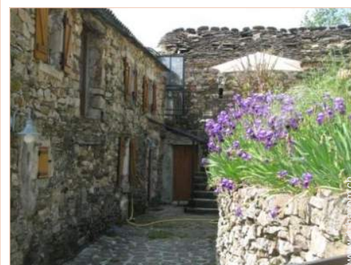
Dimora in Pietra di Charme

- Villaggio centro 2,5km - Centro città 25km - Fermata/stazionamento bus 25km - Panetteria 25km - Traiteur 25km - Negozi tipici 25km - Supermercato 25km - Salone di coiffure 25km - Internet café 25km - Ufficio postale 25km - Banca 25km - Distributore automatico di biglietti 25km - Farmacia 25km - Medico 25km - Infermiera 25km - Ospedale 50km