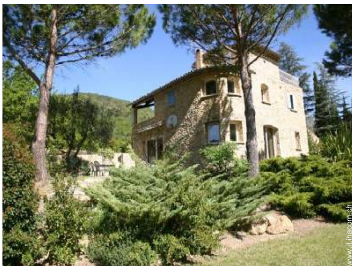
Casa in Pietra