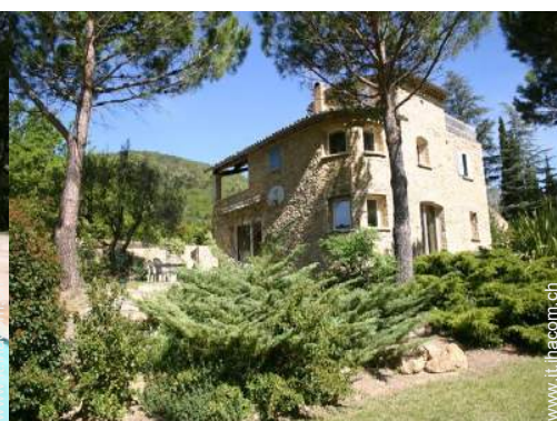
Casa in Pietra