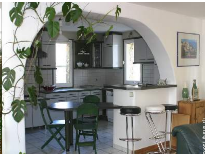
grande cucina in stile americano