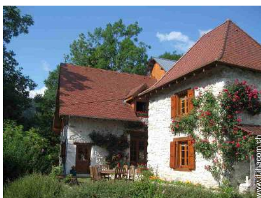
Casa in Pietra di Charme