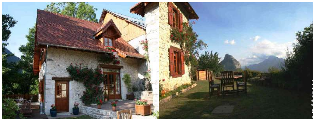
Casa in Pietra di Charme