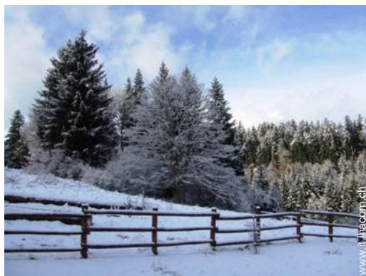
vista sulla foresta