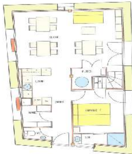
GITE DE GRANGENT - 4 CHAMBRES