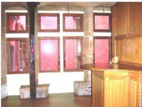
Appartamento di Prestigio