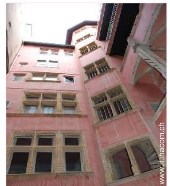
Cascina di Prestigio