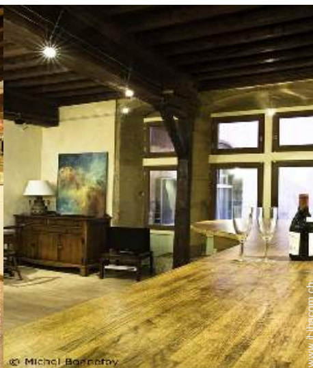
Sistemazione interna a disposizione degli ospiti