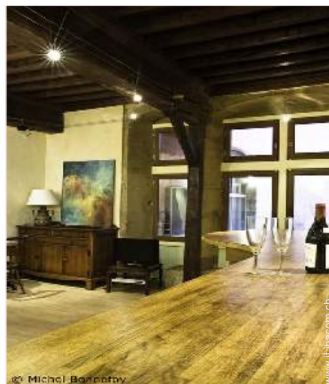
Sistemazione interna a disposizione degli ospiti