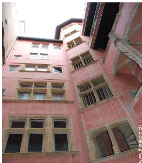
Cascina di Prestigio