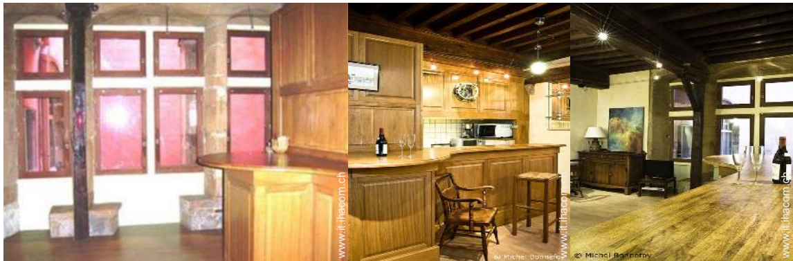
Appartamento di Prestigio