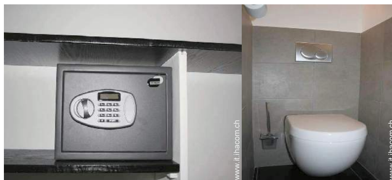
cassetta di sicurezza