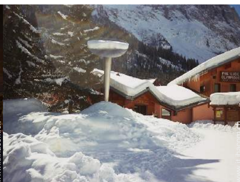
pattini da ghiaccio