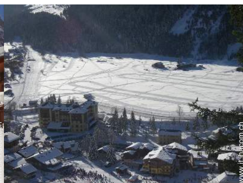
sci fuori pista