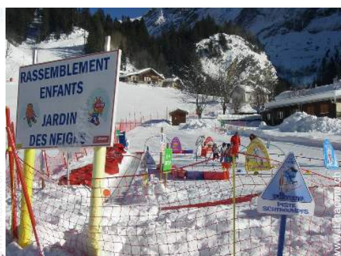
giardino delle nevi per bambini