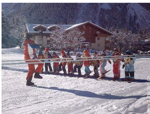
scuola di sci