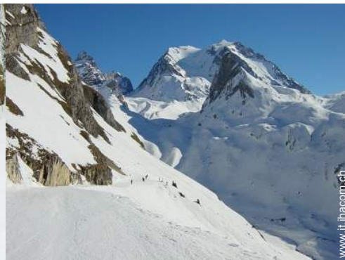
piste di sci