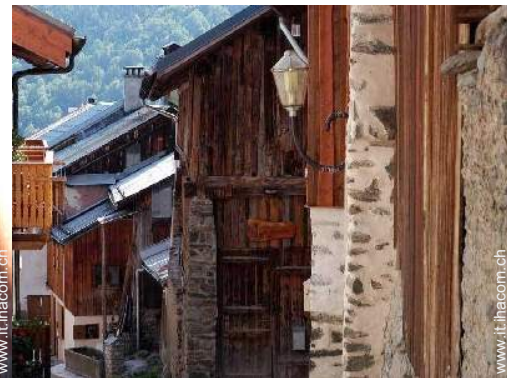
Antico Granaio di Charme