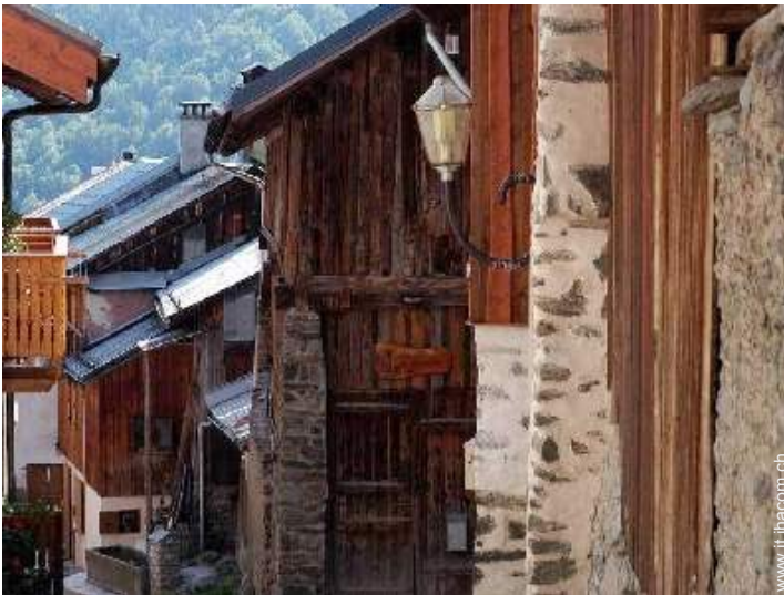
Antico Granaio di Charme