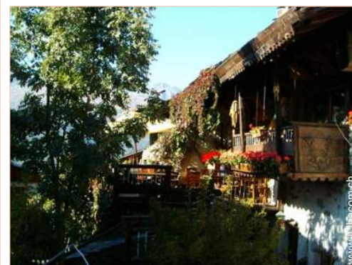
Chalet in Legno di Charme