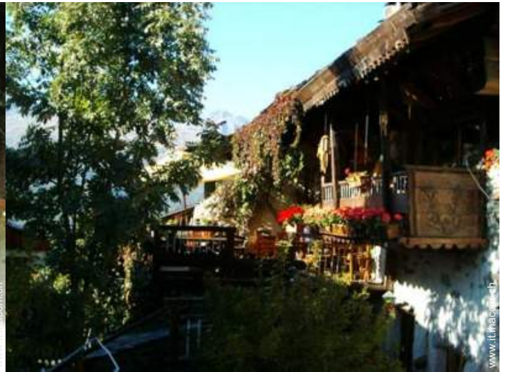
Chalet in Legno di Charme