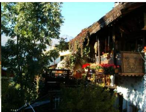
Chalet in Legno di Charme