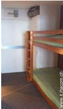
letti a castello