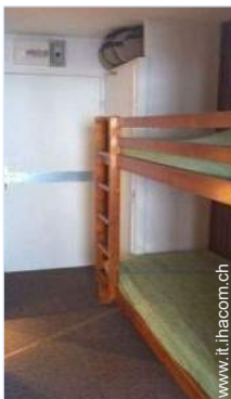
letti a castello