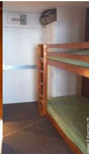
letti a castello