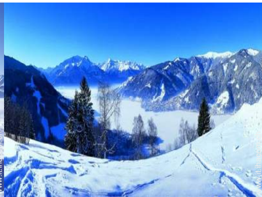
piste di sci