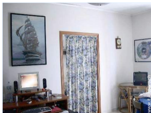
accesso internet banda larga