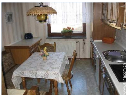
grande cucina indipendente

Attrezzo(i) per il fitness, 2 bicicletta(e)