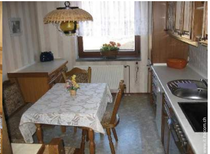
grande cucina indipendente