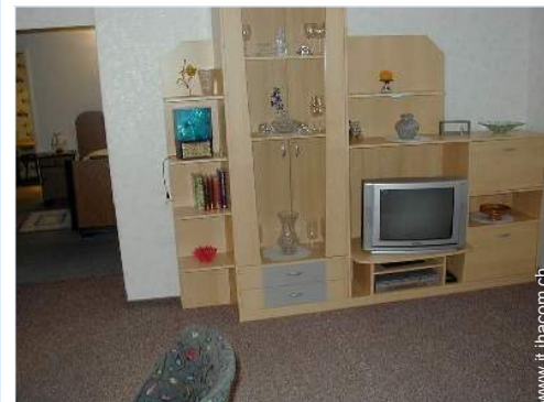
Disposizione interna e confort