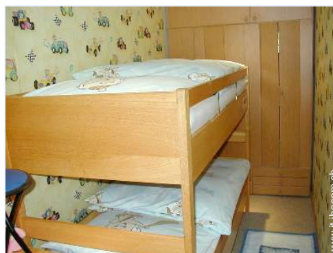
letti a castello