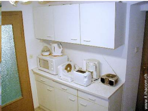
utensili e batteria da cucina