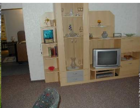
Disposizione interna e confort