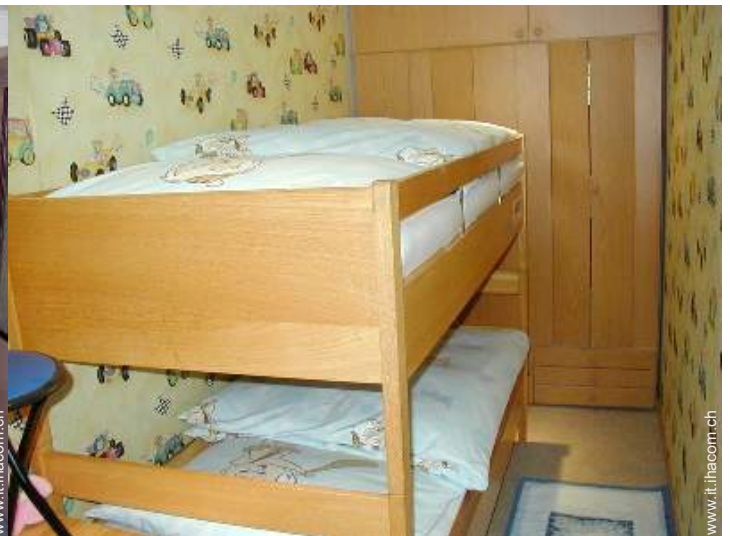
letti a castello