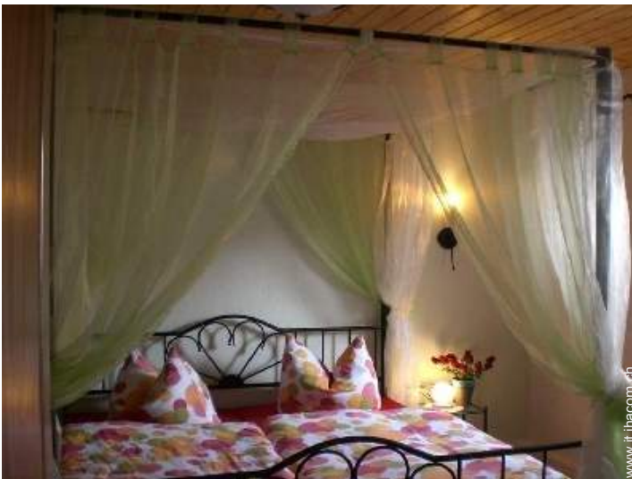
letto(i) matrimoniale(i) a baldacchino