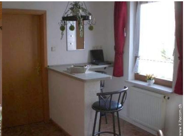
Comfort interno a disposizione degli ospiti