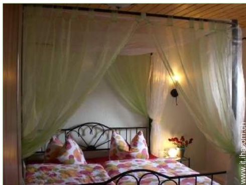
letto(i) matrimoniale(i) a baldacchino