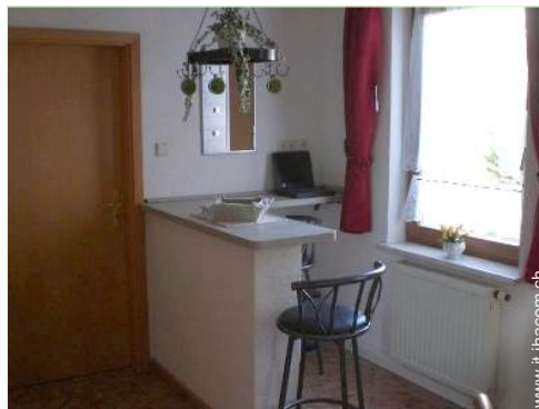
Comfort interno a disposizione degli ospiti