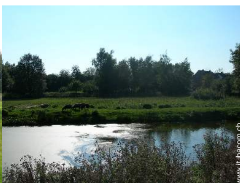
vista sul lago