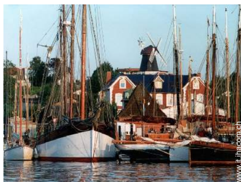
sport motorizzati nelle vicinanze