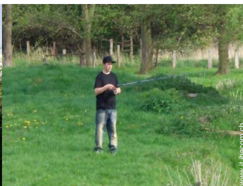
pesca con lenza