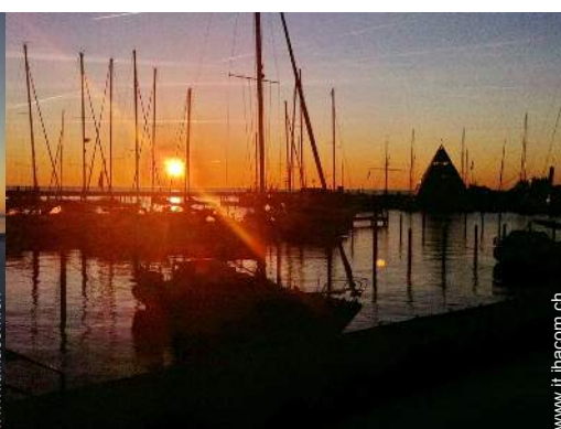
vista sul porto