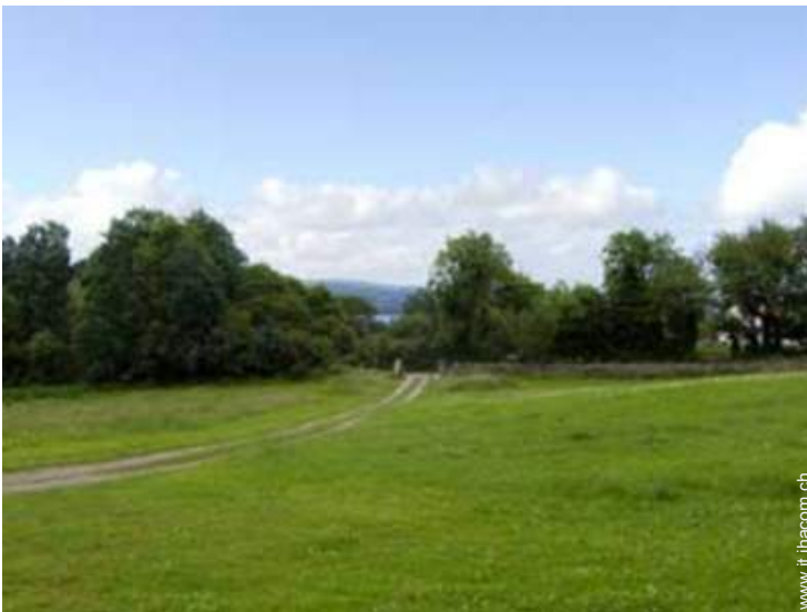
vista sui campi agricoli