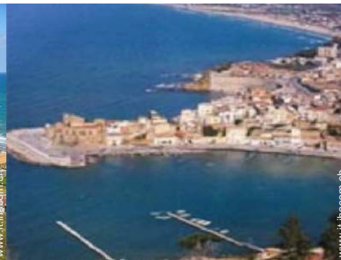
escursione in barca