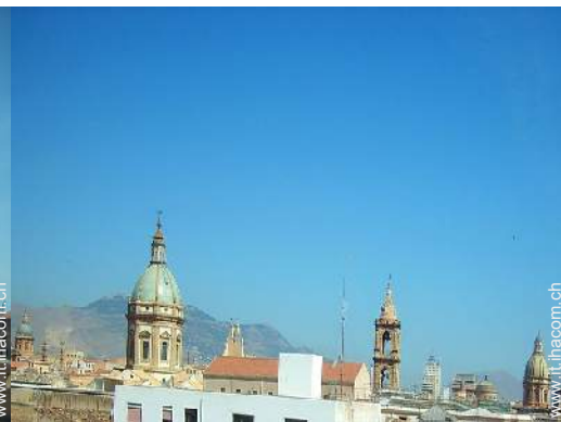
vista sui tetti