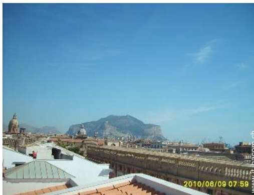
vista sui tetti