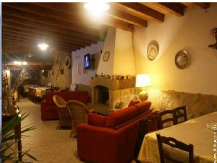
Comfort interno a disposizione degli ospiti