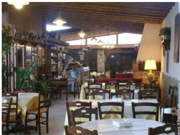
Sistemazione interna a disposizione degli ospiti