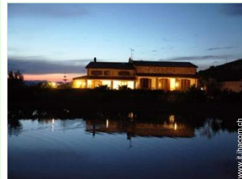
vista sul lago