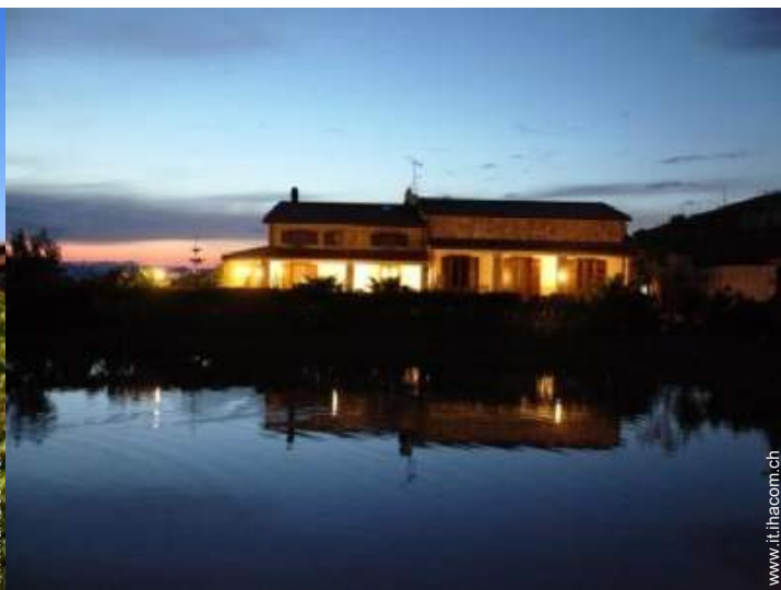
vista sul lago