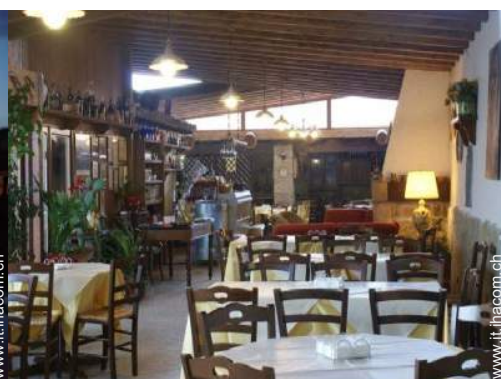
Sistemazione interna a disposizione degli ospiti