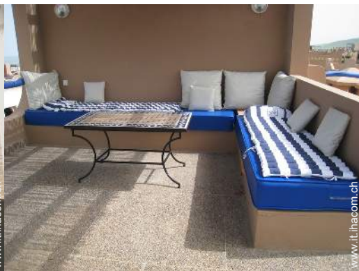
terrazzo sul tetto