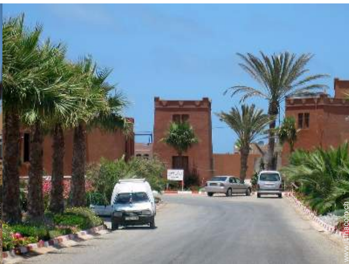
Apprezzamento di terreno