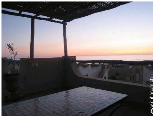
vista dal patio