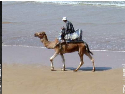
vista dalla terrazza sul tetto