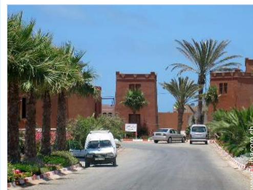
Apprezzamento di terreno