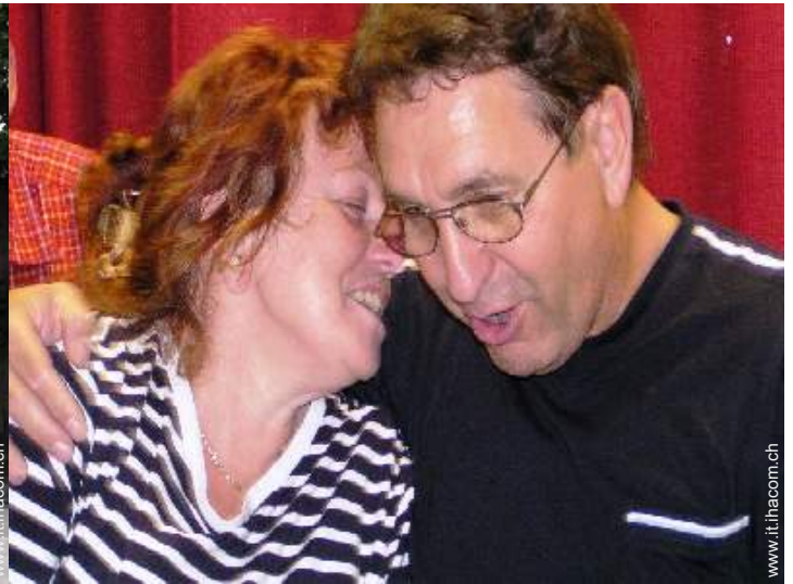
Il vostro ospite