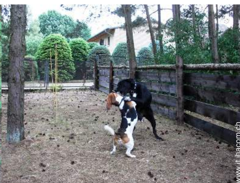
Gli animali domestici