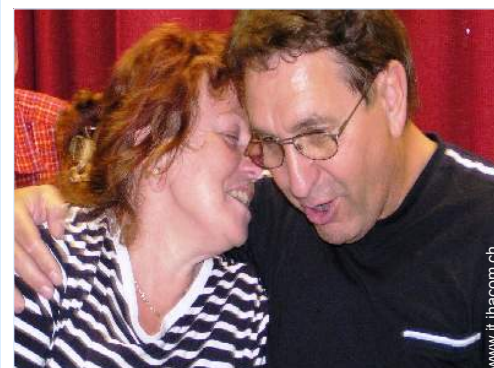
Il vostro ospite