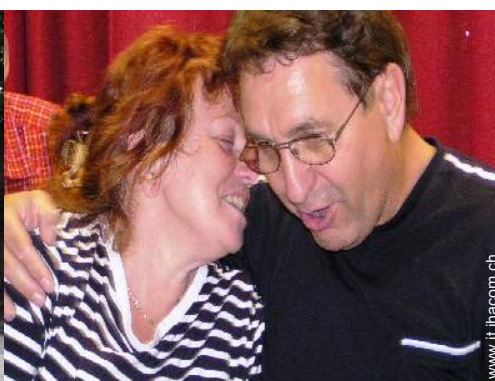
Il vostro ospite