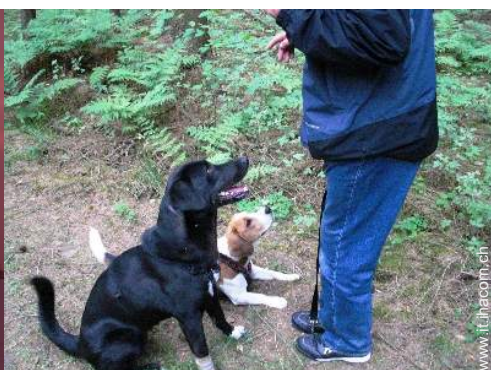
Gli animali domestici