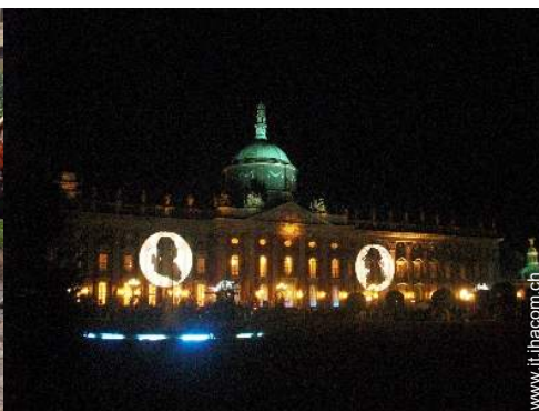
parco e giardino