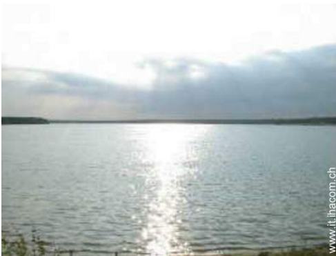
vista sul lago