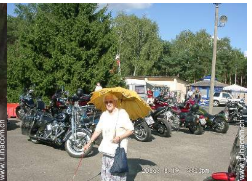
sport motorizzati nelle vicinanze