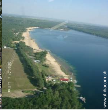
vista sul lago