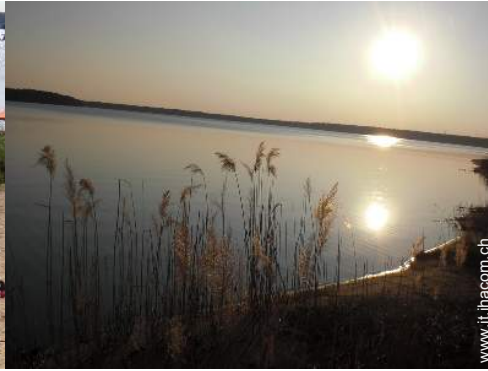
vista sul lago