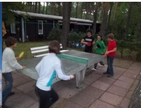
tavolo da ping-pong