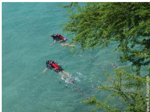
scuola di immersione