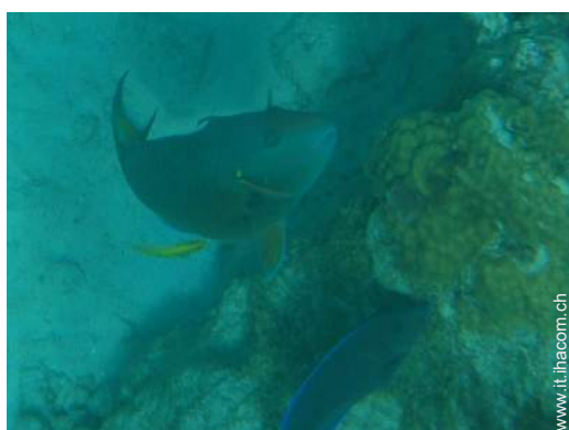
Presenza sul posto