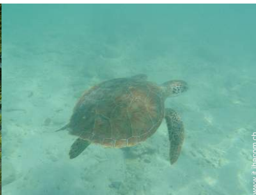
Presenza sul posto