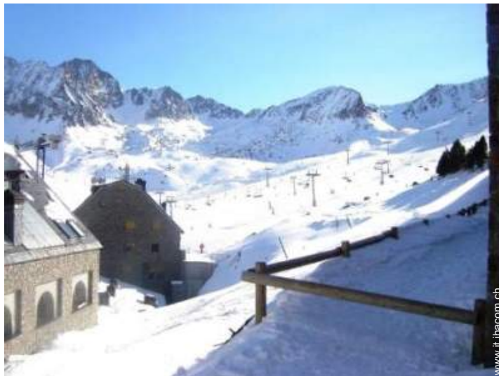
piste di sci