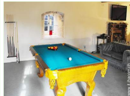
sala dei giochi