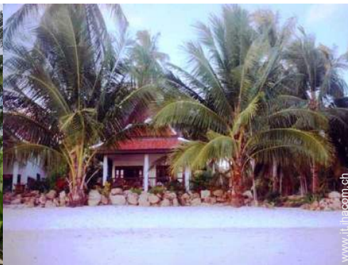
Bungalow di Charme