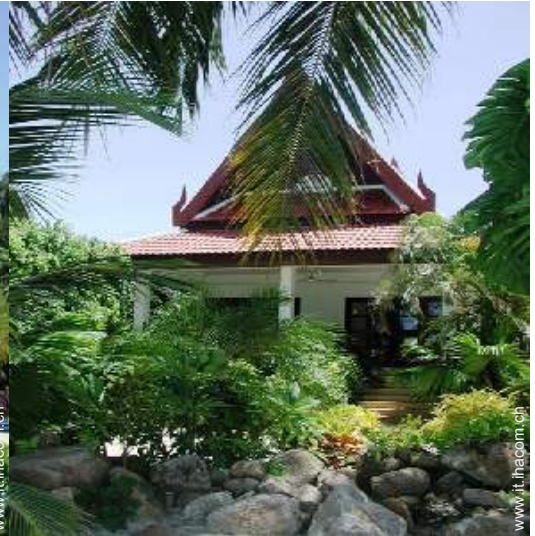
Bungalow di Charme