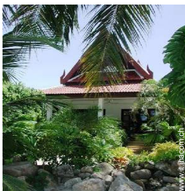
Bungalow di Charme