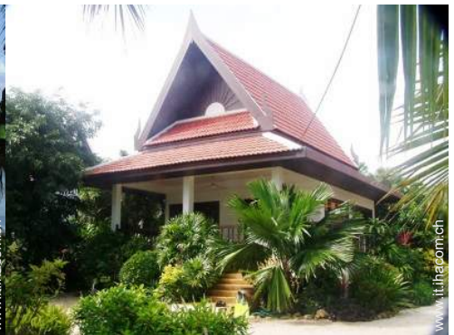
Bungalow di Charme