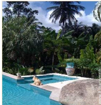
vista sulla foresta