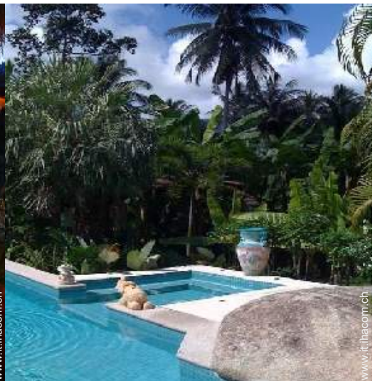
vista sulla foresta