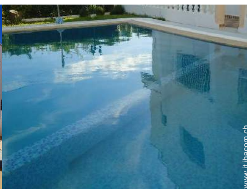
Piscina a sfioro