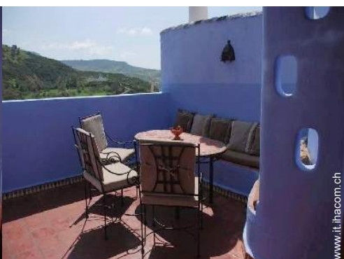
terrazzo sul tetto