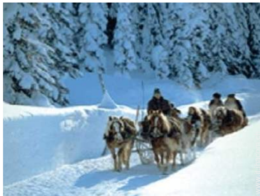
passeggiata in calesse