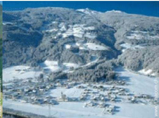
sport invernali nelle vicinanze