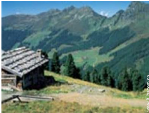
attività montane nelle vicinanze