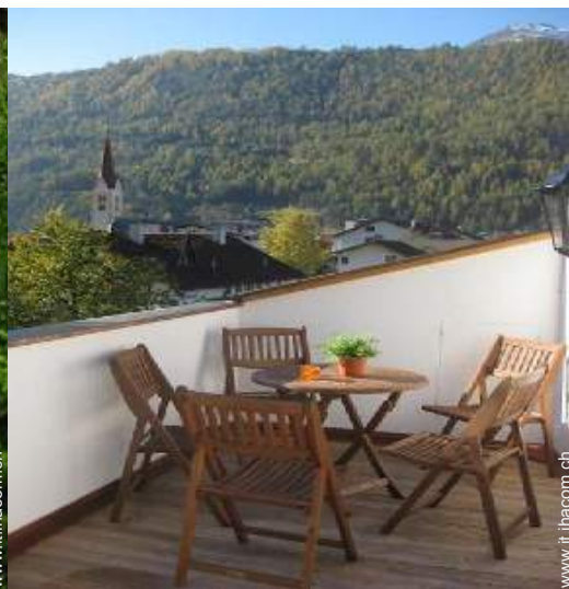
vista dalla terrazza sul tetto