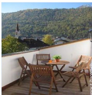
vista dalla terrazza sul tetto

Bambini benvenuti Affitto non fumatori, copertura telefonia mobile, trasporto personale consigliabile Acqua : calda/fredda Tensione elettrica : 220-240V / 50Hz Alimentazione elettrica : condotta