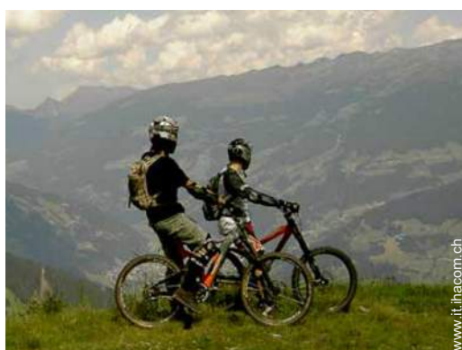
percorso per mountain bike