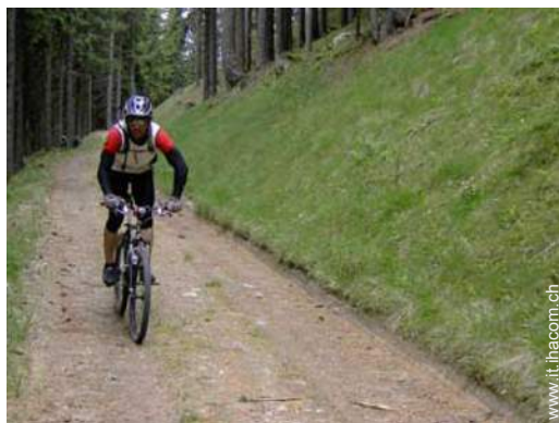
percorso per mountain bike