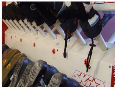
asciuga scarponi da sci

Bambini benvenuti Animali ammessi a condizioni (informarsi presso il proprietario) Presenza sul posto : animali domestici Affitto non fumatori, copertura telefonia mobile Acqua : calda/fredda Tensione elettrica : 220V / 60Hz Alimentazione elettrica : conduttura