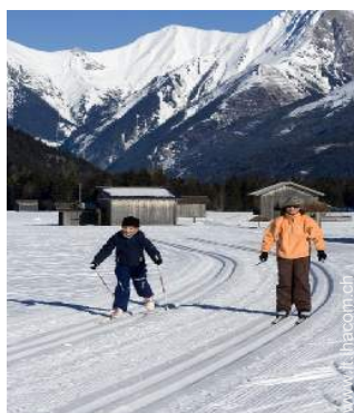
sci di fondo