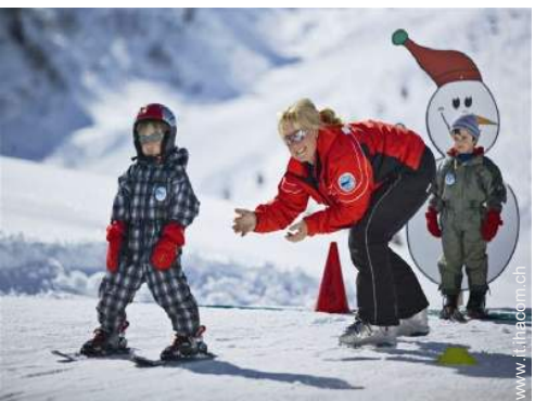
giardino delle nevi per bambini