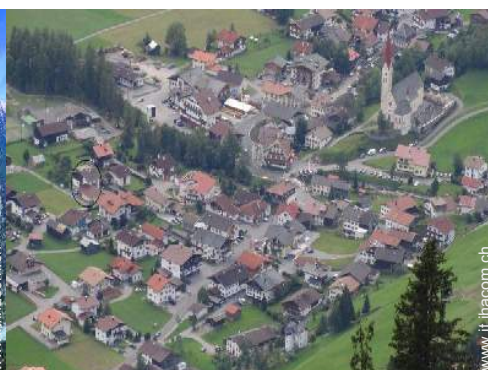
vista sul centro del paese