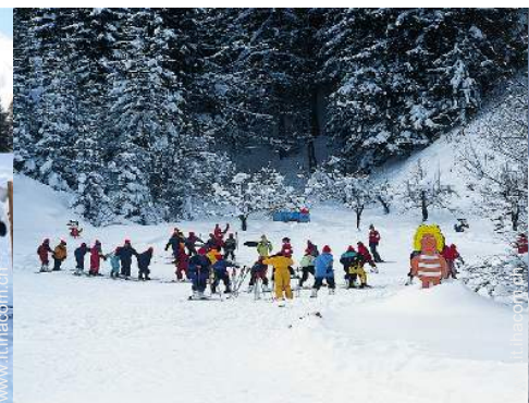
giardino delle nevi per bambini