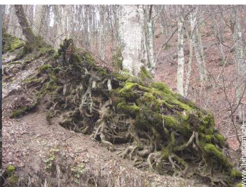
vista sulla foresta