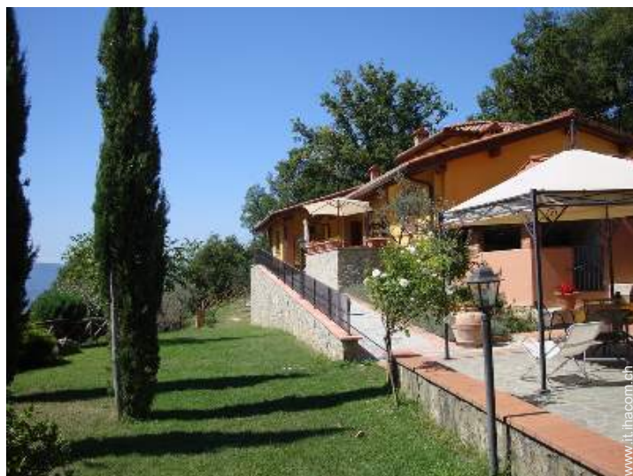
Accoglienza persone diversamente abili