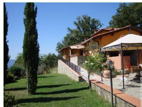
Accoglienza persone diversamente abili