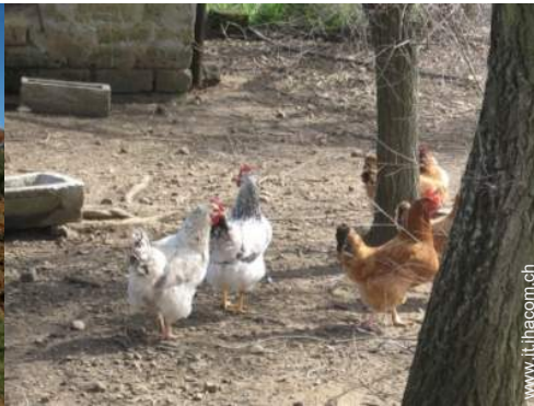
animali da fattoria