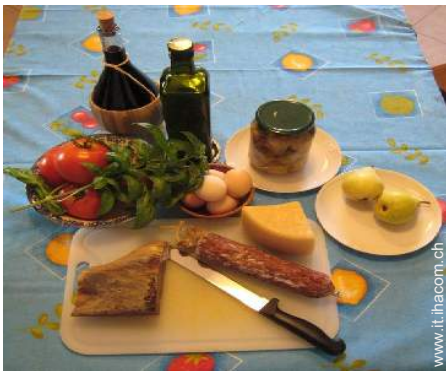
cantina e degustazione di vino